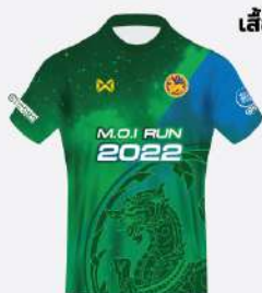
เสื้อวิ่ง