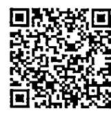
QR-Code ติดต่อ จนท.