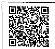
QR-Code ติดต่อเจ้าหน้าที่