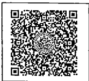
QR-Code สมัครอบรม

จึงเรียนมาเพื่อโปรดพิจารณาเข้าร่วมการฝึกอบรมและประชาสัมพันธ์หลักสูตรต่อไป จักขอบคุณยิ่ง