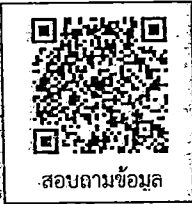
การสมัคร