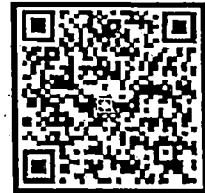
สมาคมวิศวกรรมสิ่งแวดล้อม แห่งประเทศไทย