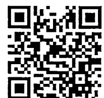
QR Code สำหรับการลงทะเบียน