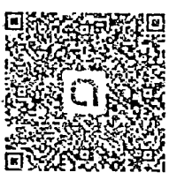
QR Code (๒)