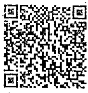
QR Code (๑)