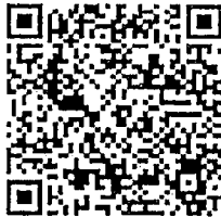
QR CODE ไฟล์หลักสูตร