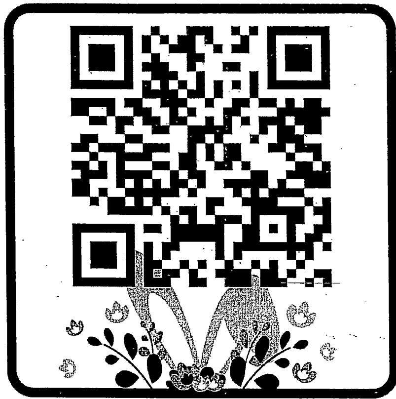
แบบฟอร์มใบลงทะเบียนอบรม