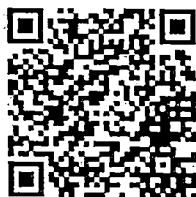
ส่งใบสมัคร